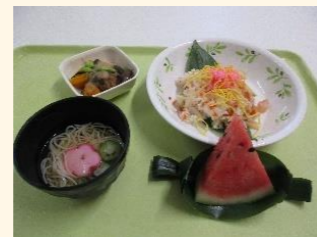
七夕御膳には 職員手作りの笹舟を