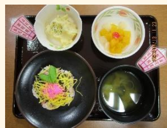
お花見御膳には ボンボリプレート

当施設では味はもちろんのこと、目で見ても楽しんでいただけるように工夫し、行事食には管理栄養士手作りのお品書きやプレートをつけてお食事を提供しています