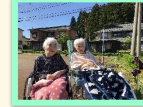
職場体験に来ていた生徒さんと 一緒にお散歩を楽しむ姿も