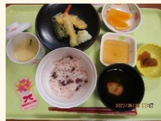
開所記念御膳には 花束プレート