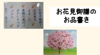
お花見御膳の お品書き