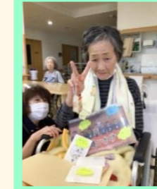
何を話しているのかな？